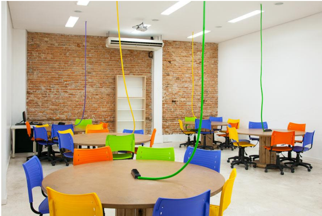
Figura 3 – Layout Hub de Inovação