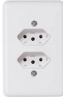
Figura 1 – Tomada Dupla