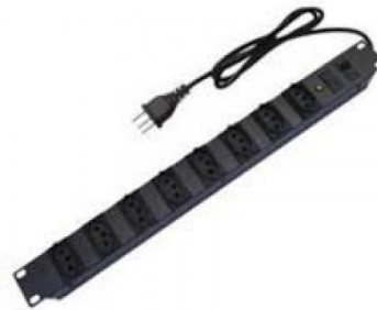
Figura 2 – Régua de 8 pontos